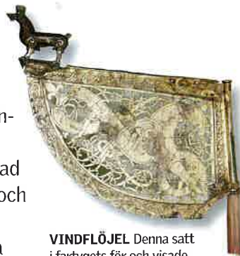
VINDFLÖJEL Denna satt i fartygets för och visade vindriktningen.

Den man som ledde vikingarna till Grönland kallades Erik Röde eftersom han hade rött skägg. Han hade blivit förvisad från Norge efter att ha dödat en man och tog sin tillflykt till Island. År 982 blev han fredlös på grund av en fejd, och då gav han sig iväg västerut.