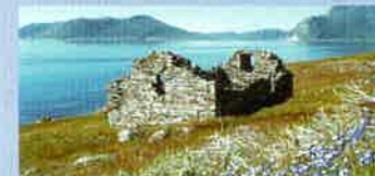
RUIN En kyrka från vikingatiden.

Kristendomen hade fått fotfäste i bosättarnas hemtrakter, och det var bara en tidsfråga innan den skulle bli populär på Grönland. Erik Röde var själv tveksam, men hans hustru var kristen och övertalade honom att bygga en kyrka. Grönlänningarna handlade med många delar av Europa och betalade tionde till påven.